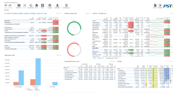
Beispiel für einen Bericht mit Kennzahlen

Bei der Datenanalyse mit Drill-down-Funktionalität kann schrittweise auf niedrigere Strukturen bis auf den Einzelbeleg verzweigt werden. Der Effekt: schneller Überblick und mehr Transparenz, z. B. bei Kostenabweichungen. Und das, ohne in andere Anwendungen wechseln oder Kollegen befragen zu müssen.