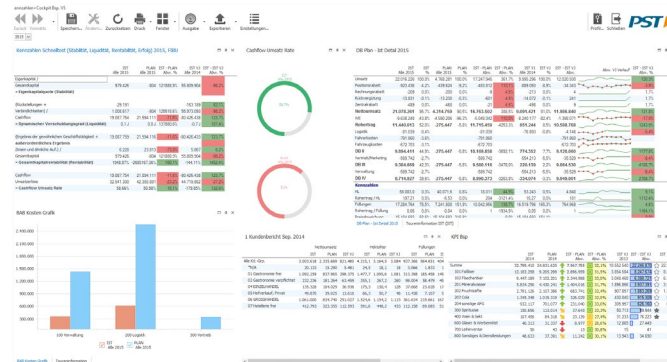
Beispiel für einen Bericht mit Kennzahlen

Bei der Datenanalyse mit Drill-down-Funktionalität kann schrittweise auf niedrigere Strukturen bis auf den Einzelbeleg verzweigt werden. Der Effekt: schneller Überblick und mehr Transparenz, z. B. bei Kostenabweichungen. Und das, ohne in andere Anwendungen zu wechseln oder Kollegen zu befragen.